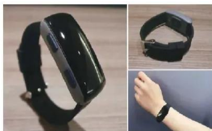
ウェアラブル端末の活用