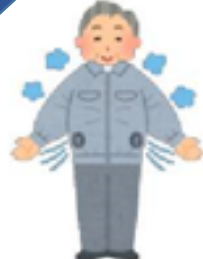
ファン付き作業服