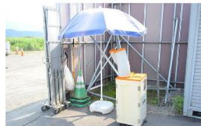
日除け・スポットクーラーの設置