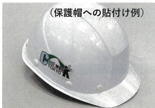
（保護帽への貼付け例）

のどが渇く前に飲む！ こまめな水分補給を忘れずに！ 熱中症予防の意識を高めましょう